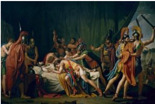
A morte de Viriato (Autor José de Madrazo)

Em 147 A.C., os lusitanos renderam-se perante as tropas de Caio Vetúlio, que os haviam cercado. Mas, Viriato opôs-se terminantemente contra essa derrota. Ele organizou as suas tropas e foi lutar contra os romanos, acabando por derrotá-los no desfiladeiro de Ronda, que faz a separação entre a planície de Guadalquivir e a costa marítima da Andaluzia, onde acabaria por matar o próprio Caio Vetúlio.